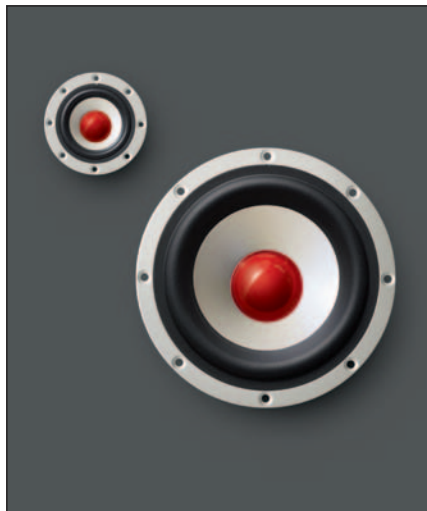
製品名：『Confidence II Sunrise』 デザインコンシャス・モデル

BEWITH(ビーウィズ株式会社)は、独自のP.P.C.(ポーラーパターン・コントロール)偏芯コーンを採用した高級オールコーン型スピーカーシステム『Confidence II』(コンフィデンス2)・『Confidence II Sunrise(サンライズ)』、5cmトウイーター『C-50II』・『C-50II Sunrise』、13cmミッドウーファー『C-130II』・『C-130II Sunrise』を東京モーターショー2011開幕初日11月30日より全国の取扱販売店にて発売致します。『C-50II Sunrise』『C-130II Sunrise』につきましては、イタリア・ミラノで開催する「Top Audio Video Show」(9月15～18日)にてワールドプレミアし、同日より海外モデルとして先行発売致します。